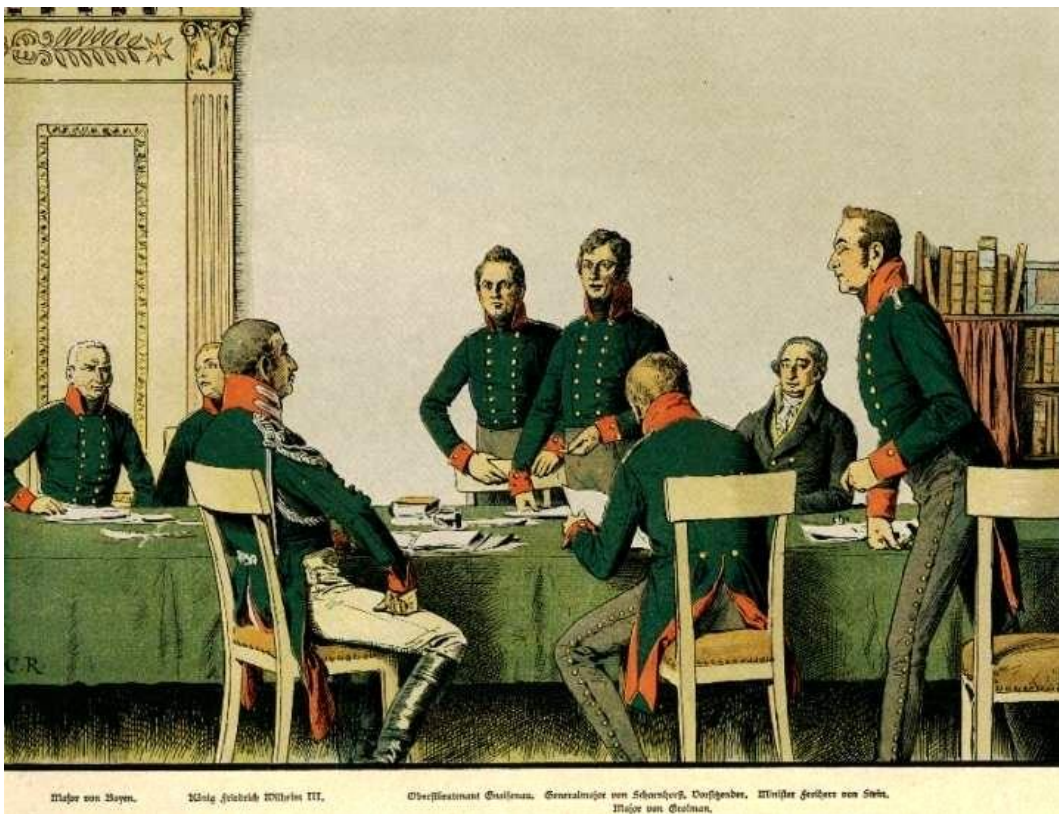
Scharnhorst (5. von links) als Vorsitzender der Heeres-Reorganisationskommission

1806 schrieb Scharnhorst an dazu seine Tochter: „Mich trifft es doppelt, da ich all die Fehler, die Dummheit, die Feigheit kenne, die uns in die jetzige Lage gebracht haben. Der einzige Trost, der innere, ist, daß ich Vorschläge von Anfang an getan habe, wie man unserm Unglück zuvorkommen konnte, die Einrichtung einer Nationalmiliz, der allgemeinen Bewaffnung des Landes im Vorigen Sommer, die Verstärkung der Regimenter, eine engere politische Verbindung. Ebenso habe ich in den Operationen immer den richtigen Gesichtspunkt gezeigt; in der Schlacht selbst habe ich den Teil, bei dem ich war, zum Siege geführt; kurz, ich habe für meine Person tausend mal mehr getan als ich zu tun brauchte.“